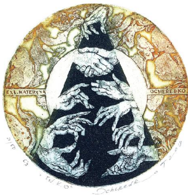
Рис. 4. Т. Очерedyкo. Екслібрис К. Очерedyкo. 2018. Техніка С3, С5, С7 (офорт)