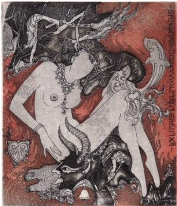
Рис. 2. Р. Агірба. Theft of Europe. Екслібрис. 2012. Техніка С3, С5, С7 (офорт, акватинга, мецо-тинто)