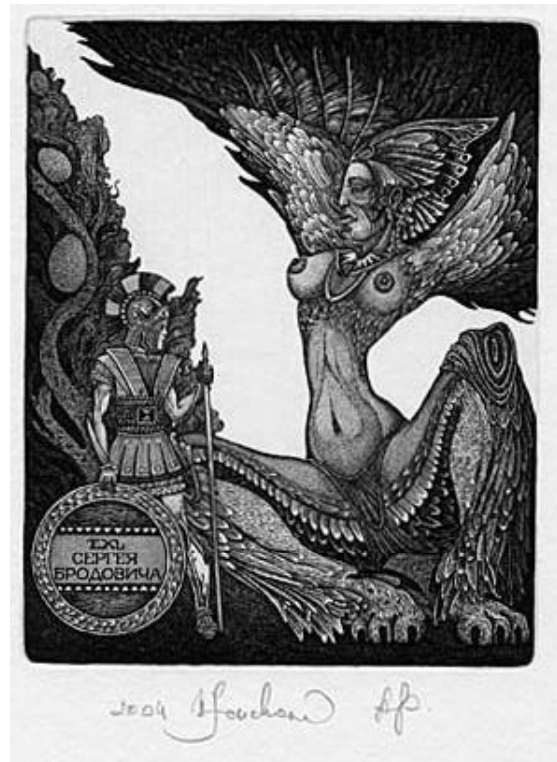
Рис. 1. В. Фенчак. Sphinx. Екслібрис Сергія Бродовича. 1994. Техніка С3, С5 (офорт, акватинта)

ньо щільний та зберігається навіть краще, ніж звичайний папір (ватман). Найбільша загроза для графіки, що друкується на папері, — волога. Проте в наш час задля подовження строку зберігання графічних аркушів у музеях та галереях існують спеціальні пристрої для вибирання зайвої вологи.