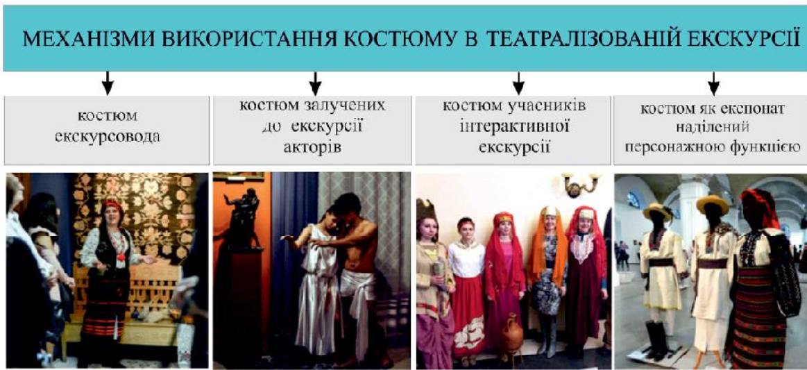
Рис. 1. Класифікаційна схема механізмів використання костюму в театралізованій екскурсії