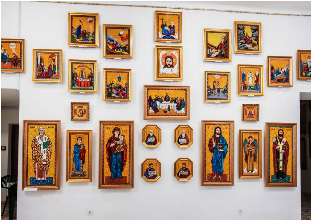
Рис. 4. Музей вишиваних ікон. Іконостасний ряд

всіх християн богословський зміст втілюється у різних техніко-формальних вирішеннях, результат ідейно-естетичної дії котрих залежить як від дотримання традиційних засад вислову в цьому виді мистецтва, так і від міри таланту такого іконографічного твору.