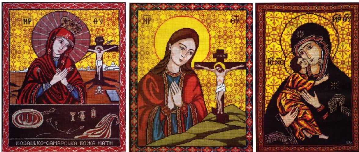
Рис. 3. (Зліва направо) Козацько-Самарська, Охтирська і Вишгородська Богородиця