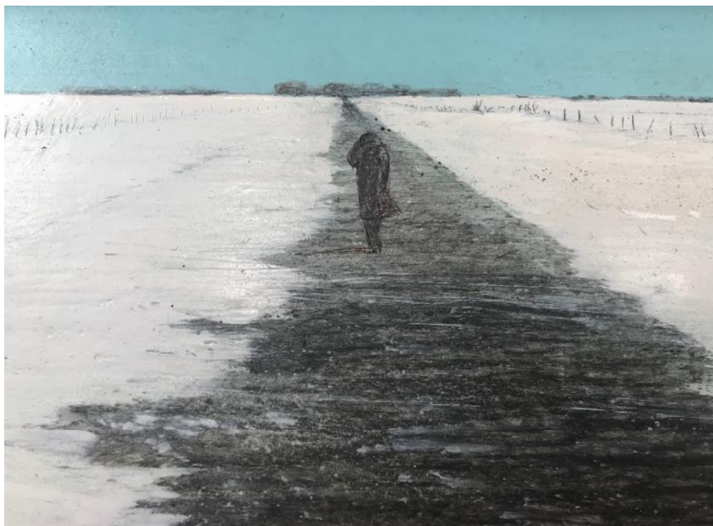
Рис. 1. Самотність. Дорога. 1973. Мішана техніка, мезоніт. 13,5 × 34 см. Колекція Марії Стиранки. Торонто, Канада. Фото Х. Береговської, 12.2017